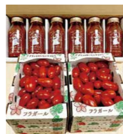
▲いわきの農林水産物