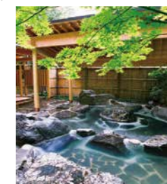
▲市内施設の宿泊券