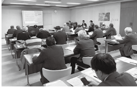
▶成田市役所で有機農業に関する説明を受ける