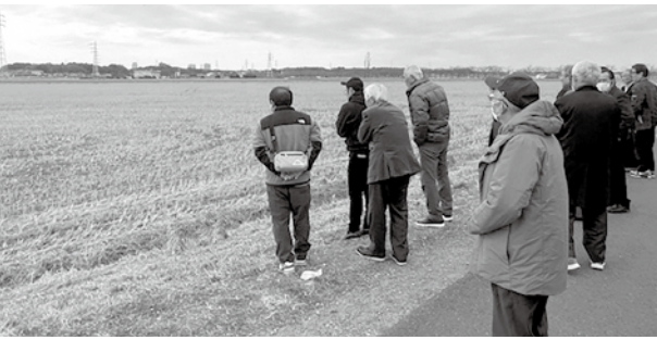
▲印旛沼の農業用排水施設の視察光景

令和2年度に完成した宗吾西機場を見学することになりました。内径19.9m、壁高27.8mの円柱型の吐水槽がひときわ目につきました。最大排水量1710m 3 の用水が周辺の水田に満遍なく行きわたる様が目にかぶようです。 現在いわき市でも有機農産物を学校給食に取り入れられていると聞きますが、その使用量の割合が多くなることを期待したいと思えます。『子供たちの未来のために』 (撮影・執筆 四家 誠)