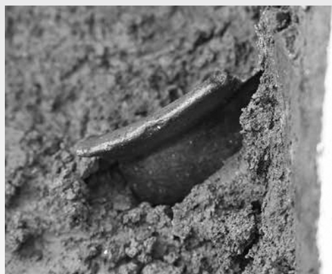
【古墳時代】土師器甕