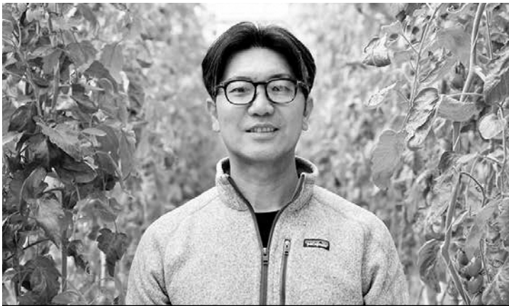
株式会社JRとまとランドいわきファーム 四倉町中島

平成26年9月に設立された農業生産法人で、約1.7haの大規模ハウスに年間を通して約10種類のトマトを栽培しております。平成29年4月にJGAP、平成30年8月にはFGAPを取得し、適切な農産物の生産工程管理を行い、品質や安全性、労働の安全性にも配慮した持続可能な農場運営に取り組まれております。また、生産されるトマトの一部は「サンシヤイントマト」として出荷され、業務用トマトも栽培し、商社へ販売するなど販路拡大に努め、グループ会社と連携し、トマトの収穫体験の実施や6次化商品の開発に取り組むなど、いわき産トマトのPRに貢献しており、本市農業の振興に寄与されております。