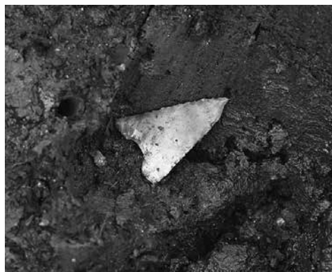
【縄文時代石鏃(やじり)】