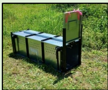
クマ捕獲用箱わな