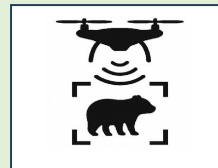
ドローンによる調査（イメージ図）