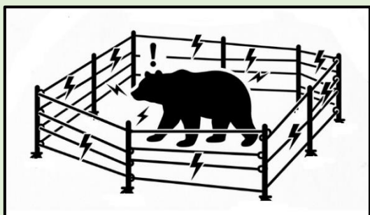
ポータブル電気柵（イメージ図）