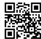
(フラ・ジョブIWAKI登録)