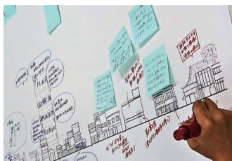
未来のまちなみのアイデアを出す