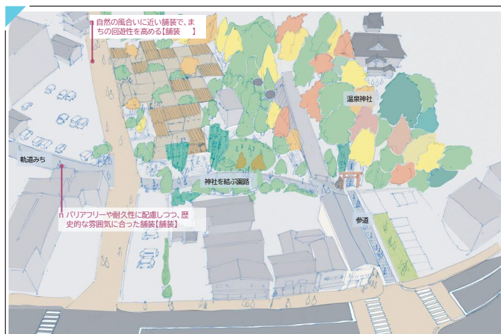
支所跡地・温泉神社周辺の空間づくり

サポートブックには、湯本のまちなみの将来像やまちなみづくりのアイデアが描かれており、今回のまちあるきや社会実験を通して、少しずつカタチにしていきます。