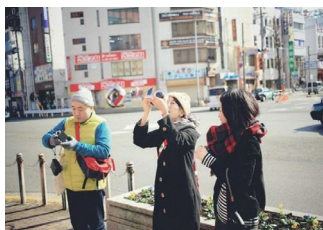
カメラを使って魅力を見つける

実際に湯本のまちをみんなで歩きながら、アイデアを出し合い、未来のまちなみを想像・創造していきます。