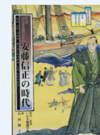
『漫画「いわきの歴史から」安藤信正の時代』