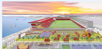
新スタジアムパース