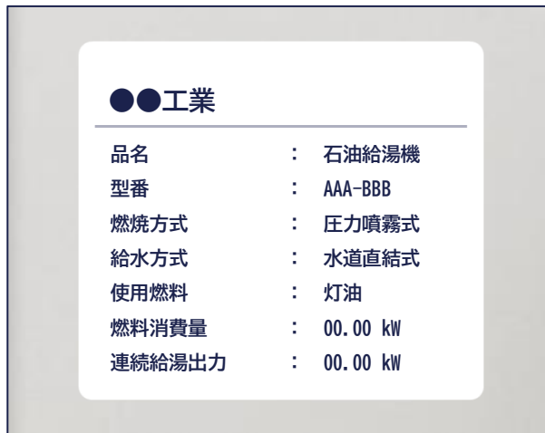
□ 灯油ボイラー撤去後の状況がわかるもの