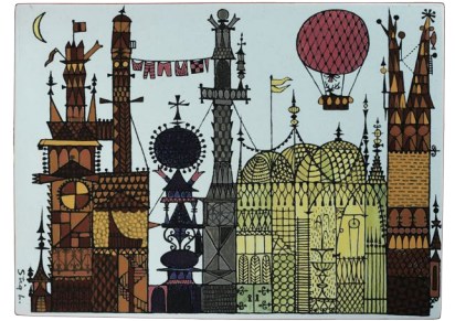
【カーニバル】シリーズスタイル/街並み図板、1962年、絵付:エドゥアルト・ベルヒトルト