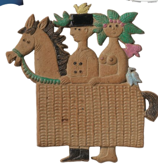
【ジンジャー・ブレッド】シリーズ/ 四つのクリスマス・デコレーション、1970年代

*作品写真は全てリンドベリ家コレクションから ©Stig Lindberg Photo: Per Myrehed