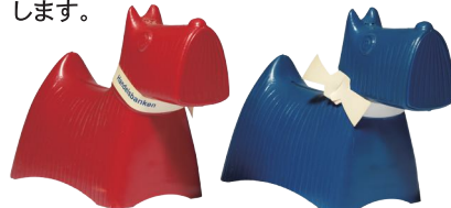
スコッチ、スコッチ:テリア形貯金箱、1961年

スティグ・リンドベリ(1916-1982)は、スウェーデンの陶芸家・デザイナーです。1937年にスウェーデンのグスタフスベリ磁器工房に入社すると、鮮やかな葉っぱの模様がさわやかな「ベルサ」シリーズなど、世界中に知られる名作プロダクトを数多く手がけました。機能性とは何か、調和や美とは何かを追求し、独創的なアイデアをもとに新たな表現方法へと挑戦し続けた彼のデザインは、現在もなお高く評価され、没後40年以上を経た今も多くの人々に親しまれています。本展では、日本でも人気のある食器や皿などのテーブルウェアに加えて、ファイアンス(錫釉陶器)や一点もののアートピース、テキスタイル、絵本の挿絵、スケッチ、日本とのかかわりを示す作品など、初期から晩年までの作品を展示します。北欧デザインのパイオニアとして活躍したスティグ・リンドベリの魅力を網羅的に紹介します。