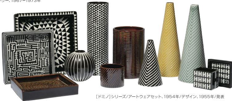
【ドミノ】シリーズ/アートウェアセット、1954年/デザイン、1955年/発表