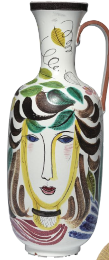
手付大型花瓶、1940年代。 スティグ・リンドベリ自身が絵付をしたユニークピース。