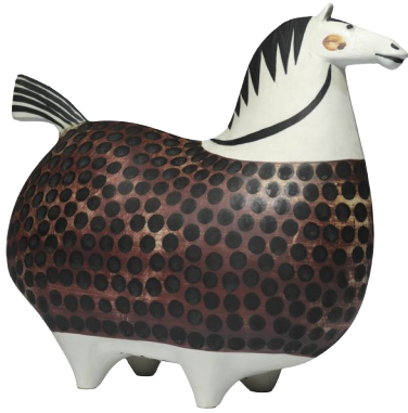
【スプリングガレ】シリーズ/大きな馬、1958年