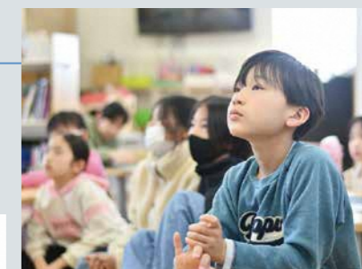
■学童での減塩教室の様子