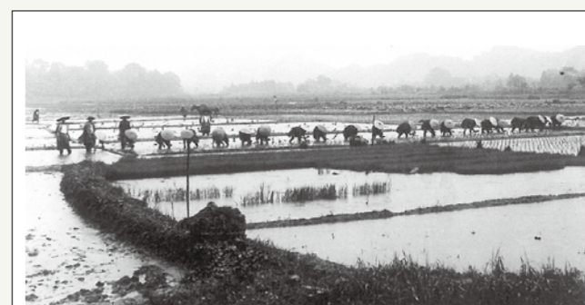
写真1 好間村における結による田植 (昭和10年代)

昭和52(1977)年5月19日付『いわき民報』は「田植機の普及と性能向上で作業の省力化が進み、田植期間も大幅に短縮された。田植機を所有している農家は80%ほど。田植期間も短縮され、70a前後の田植に家族2、3人で4、5日かかっていたが、動力を使うと、1人が1日半で終えることができるというスピードぶり」と報じています。