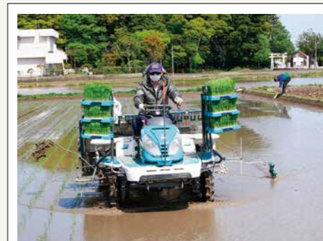
写真2 平中神谷における田植 (令和4(2022)年4月)