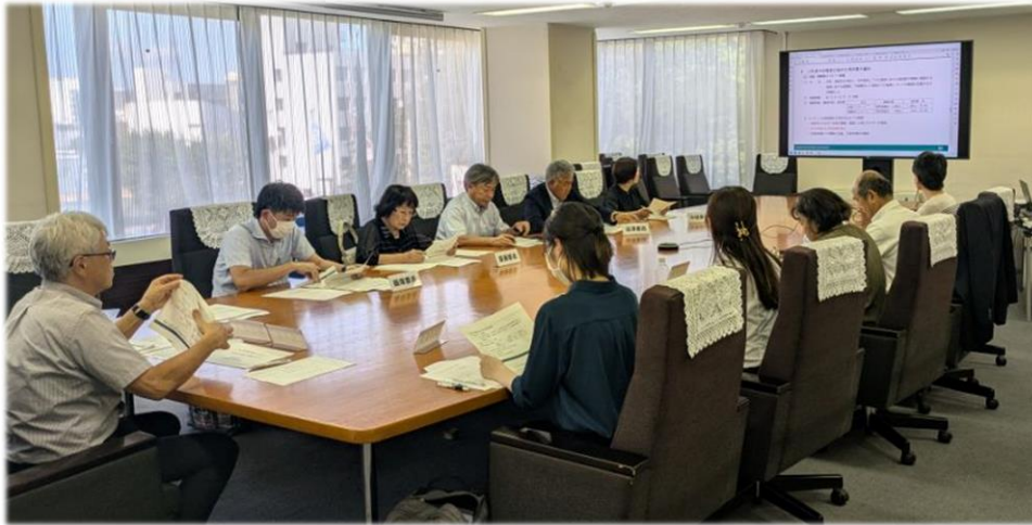
■環境審議会の様子