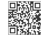
特設サイトはこちら

日程 10月17日(金)～11月9日(日) 場所 地図、店舗情報については特設サイトに掲載