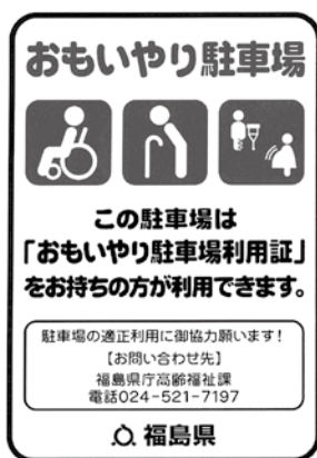
駐車場に掲示するステッカー