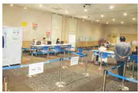
▲イオンモール小名浜に設置された期日前投票所

答 若い世代の投票率向上を目指し、未来の有権者育成事業等の継続実施や中学生が製作した選挙啓発動画をSNS等で発信する取組も実施しました。また、小名浜地区の投票率向上のため、イオンモール小名浜に期日前投票所を設置する取組を実施しました。