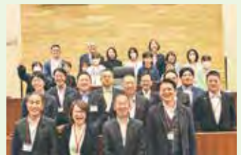
▲最後にみんなで記念撮影