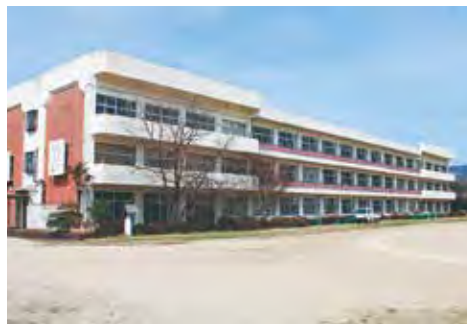
▲旧いわき湯本高校遠野校舎

旧いわき湯本高校遠野校舎への移転も含め、最適な整備手法について検討していきます。