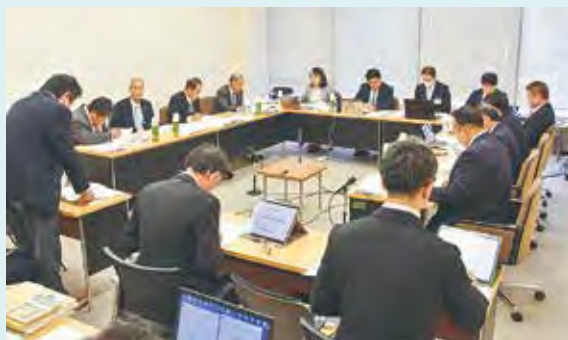
◀特別会計決算特別委員会の審査の様子