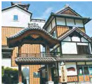
▲さはこの湯公衆浴場

答 上の湯公衆浴場は、耐用年数31年に対し46年が経過し、昨年度の入浴客数は2万1390人です。さはこの湯公衆浴場は、耐用年数31年に対し29年が経過し、昨年度の入浴客数は10万4713人です。みゆきの湯公衆浴場は、耐用年数11年に対し17年が経過し、昨年度の入浴客数は8万7097人です。