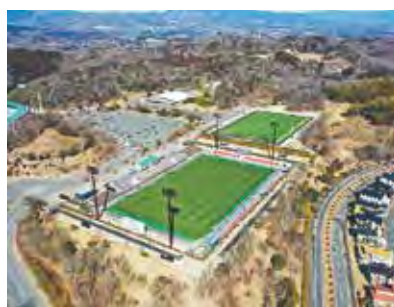
▲ハワイアンズスタジアムいわき（手前）アロハフィールド（奥）

答 いわき駅北口交通広場に直結する場所に移転し、延床面積は、現在の建物よりも拡張し、約1万5400㎡、病床数は現在と同じ199床、診療科は内科や外科など、現