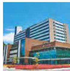
▲いわき市医療センター