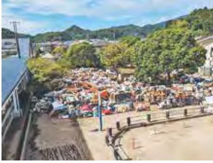
▲内郷駅前にできた仮置場(令和5年9月)

答 臨時集積所のレイアウト作成や運用方法について支援するほか、開設訓練の実施も検討します。