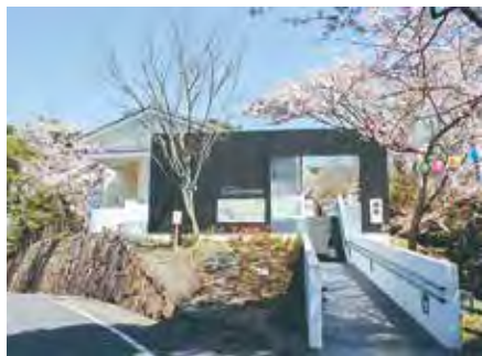
▲勿来関文学歴史館

答 勿来関文学歴史館は前回のリニューアルから23年が経過し、映像機器等の劣化や展示物の老朽化により、集客力が低下している状況にあります。このような中、本年7月に「勿来地区『民・官』協働勉強会」を立ち上げ、勿来の関に関する研究成果の共有に加え、文学歴史館の活用策について検討することとしました。市としては、当該勉強会や地元の皆様の意見を踏まえ、吹風殿を含む勿来の関を活用した振興策とあわせて、多様な観点から検討を深めます。