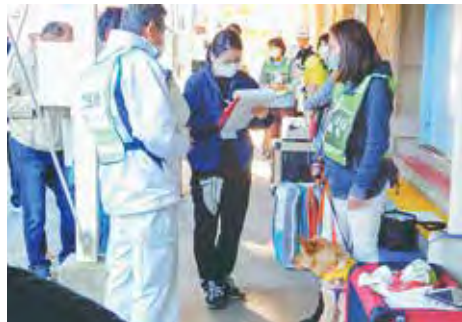
▲ペット同行避難訓練の様子