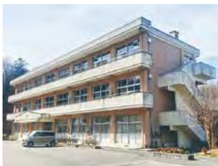
▲川前支所の移転先となる旧桶売中学校