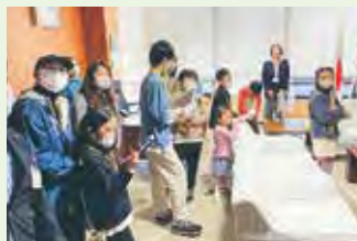
▲議長室をみんなで見学