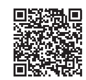
Các cơ sở dành cho người cần được chăm sóc đặc biệt trong khu vực dự kiến ngập lụt, v.v.