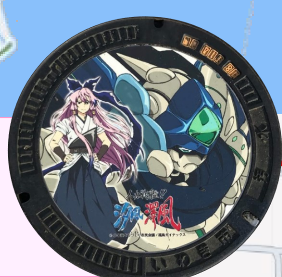
汐風 イオンモール 小名浜店前