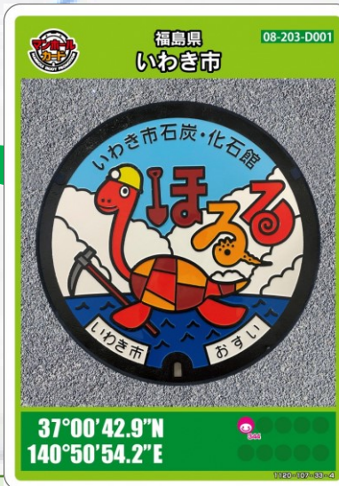
ほるくん いわき市石炭・化石館