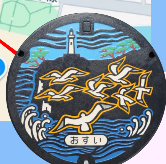
かもめ イオンモール 小名浜店前