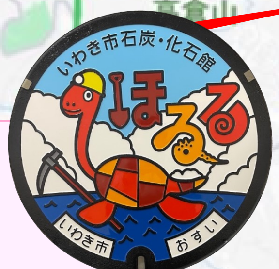
ほるくん いわき市 石炭・化石館内