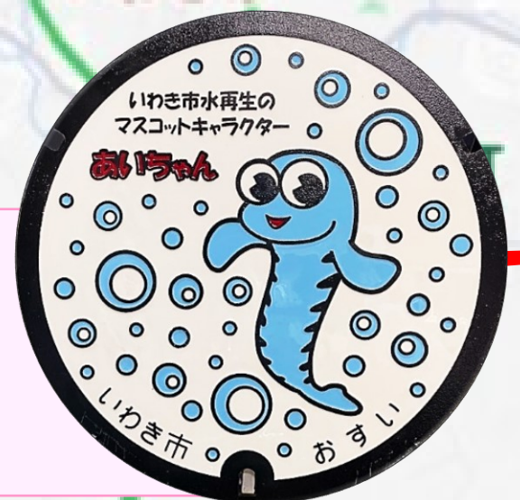
あいちゃん セブンイレブン 内郷駅前店前