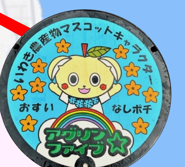
なしポチ ヨークベニマル 平谷川瀬店前