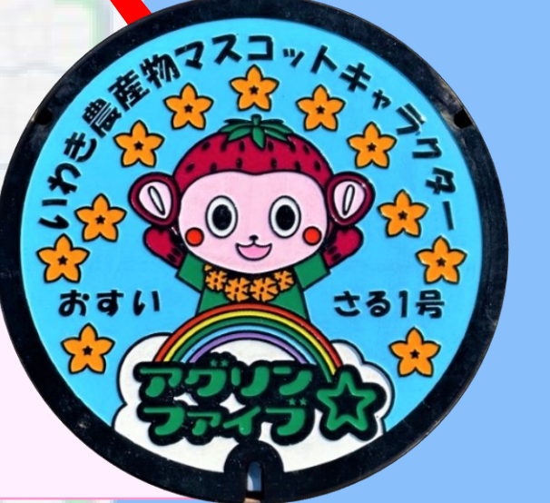
さる1号 マルト草野店前