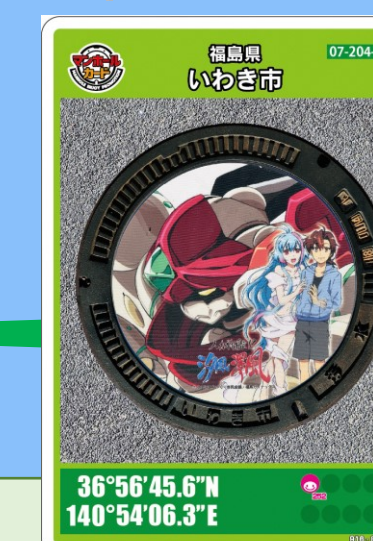
澤風 いわきマリンタワー