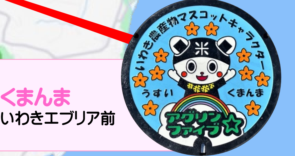
くまんま いわきエブリア前