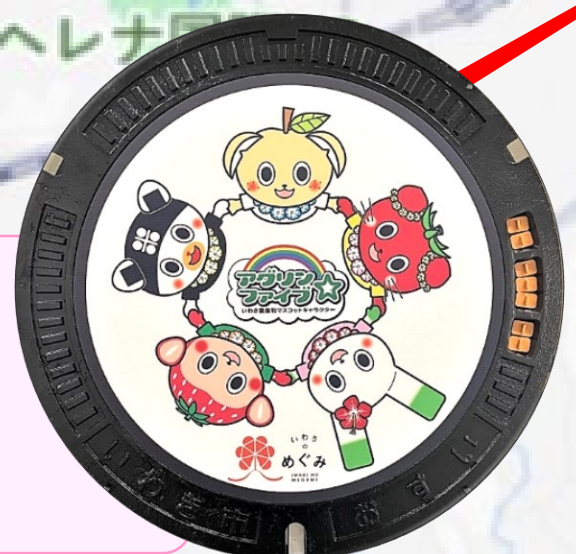
アグリ☆ファイブ ヨークベニマル いわき泉店前