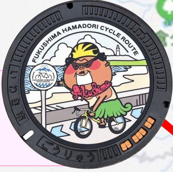
フラおじさん いわき駅南口 西側エレベーター前