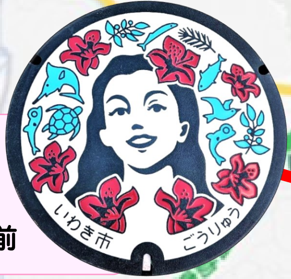
フラシティ いわき いわき市役所本庁舎前