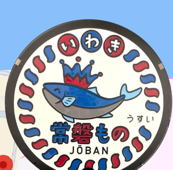
常盤もの イオンモール 小名浜店前