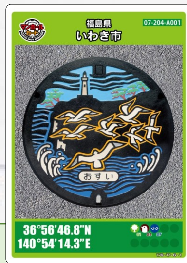
かもめ いわき・ら・ら・ミュウ