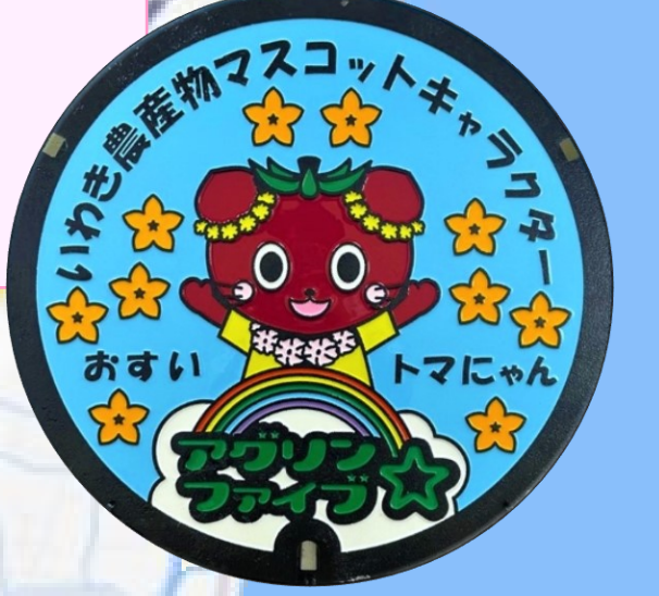
トマにゃん いわき市 四倉支所前