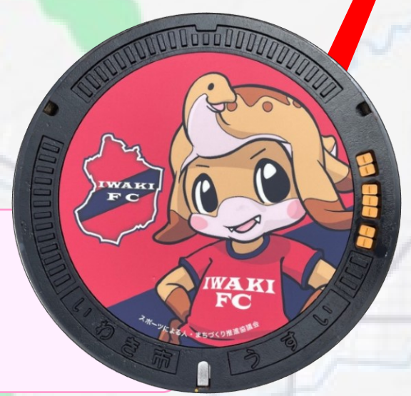
いわきFC ハーマー&ドリー 湯本駅前