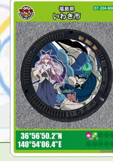
汐風 観光遊覧船サンシャイン シーガル受付