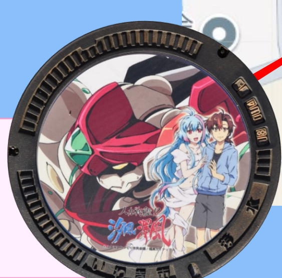
澤風 イオンモール 小名浜店前