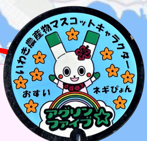
ネギびょん いわき市勿来支所前