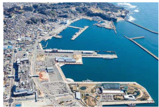
■写真2 小名浜港1, 2号ふ頭を西側から俯瞰 【平成31(2019)年3月 いわき市撮影】

の機能に「親水空間」「ウォーク・サイクリング」という新たな機能を付加した活用を模索し、昭和61(1986)年度からは、小名浜港を含め、全国の重要港湾を対象に港湾の再開発可能性を調査する「ポータルネットワーク調査」が行われました。こうして、小名浜港では、1号ふ頭には「いわき・ら・ら・ミュージアム」、2号ふ頭には「アクアマリンふくしま」が配置され、現在一帯は交流空間としてもにぎわいをみせるようになりました。(いわき地域学会 小宅幸一)