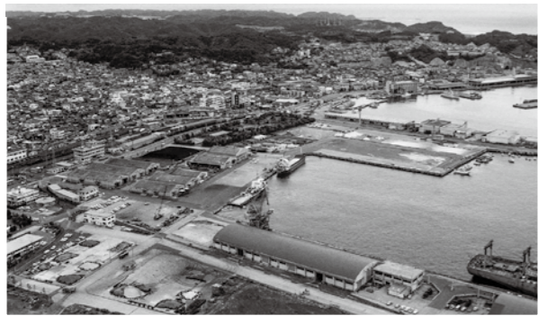
■写真1 小名浜港1, 2号ふ頭を西側から俯瞰 【昭和62(1987)年8月】

小名浜港の1号ふ頭は昭和13(1938)年(その後、拡充)2号ふ頭は昭和41(1966)年にそれぞれ完成し、小名浜港の物流面だけでなく、小名浜の発展に大いに寄与してきました。しかし、船舶の大型化に伴って水深の浅い岸壁では大型船の入港が困難となっていく、改修するにしても多額の費用を要しました。このことから、国はこれまでの「物流」「産業」一辺倒だった港