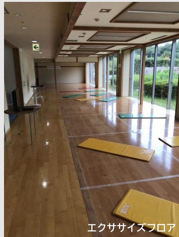
エクササイズフロア