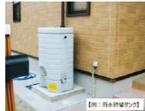
【例：雨水貯留タンク】