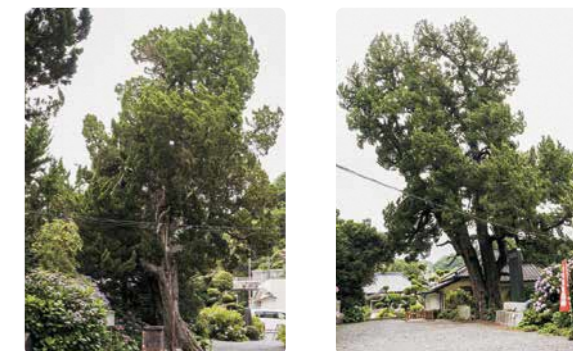
▲ビャクシン(イブキ)雄株 ▲ビャクシン(イブキ)雌株

福島県内では元々まれな樹種であり、既知の現存木では最も大きな巨樹で、樹齢500年以上と推定されます。隣接する自生地に由来すると考えられ、郷土樹種の遺伝子資源としても貴重です。