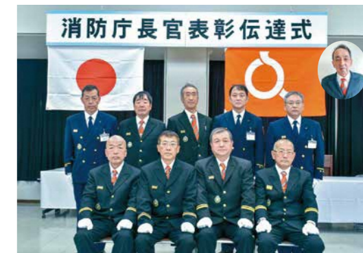
※年齢・階級は3月1日現在。支団(所属、階級)順・敬称略