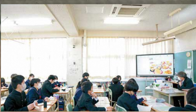
▲市内全ての小中学校に整備されたエアコン

こうした競輪事業の収益に基づく財源は、小中学校のエアコン整備・トイレ改修、保育所の整備、河川改良事業など、幅広い事業に役立てられています。