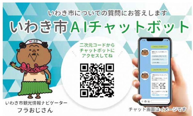
▲二次元コードから気軽に問い合わせください