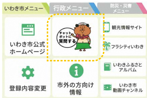
▲市公式LINEリッチメニュー画面