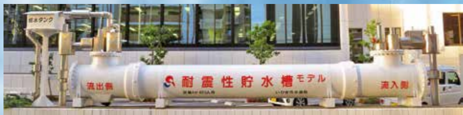
水道局本庁舎前にある、耐震性貯水槽のモデルです。容量は実際の10分の1で、4㎡(4,000ℓ)が蓄えられています。