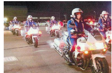
年末警戒パトロール (令和4年)

年末年始は、金融機関、コンビニ等を狙った強盗事件やひったくり、車上ねらい等の街頭犯罪の多発が懸念されます。また、子ども・女性や高齢者が被害となる事件等の発生も多く見られます。このようなことから、県警察、県防犯協会連合会、各地区防犯協会、防犯ボランティア等の関係機関・団体、地域の皆様の参加による地域安全活動を展開し、事件・事故のない住みよい福島県の実現を図ろうとするものです。 県民の皆様のご協力をお願いいたします。