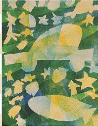
《海を走る車》 平四小2年 高野迅斗