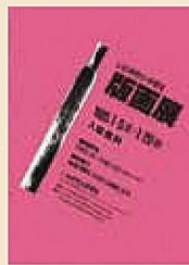
写真左 第1回展(1985年)ポスター デザイン：滝田清栄

歴代のポスターや会場風景写真など懐かしい資料で版画展の40年を振り返ります。昭和、平成、そして令和へ、「小・中学生版画展」が3つの世代を繋ぎます。