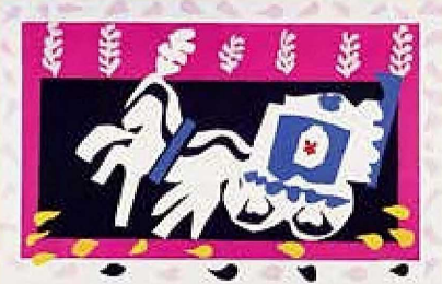
アンリ・マティス《ピエロの葬式》(版画集「ジャズ」より) 1947年 ステンシル紙

世界の巨匠たちも版画の魅力を知り、多くの作品をのこしています。今回は、当館所蔵品の中からマティスとピカソの版画約30点を展示します。いわきの子もたちと世界の巨匠たちの版画の共演をお楽しみください。