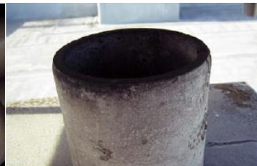
煙突の内側に使用 石綿含有断熱材