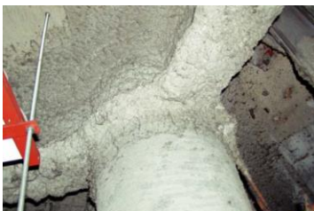
柱や梁に施工 吹付け石綿