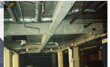
鉄骨を被覆して保護 石綿含有耐火被覆材