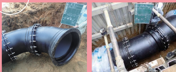
After 耐震性に優れた水道管

現状 水道管の総延長は約2,281km(令和4年度末時点)もあるため、年間約23kmを目標に計画的な取替えを進めています。