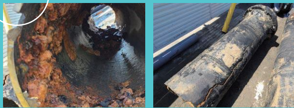
Before 取替前の腐食・破損した水道管

古くなった水道管は腐食などで破損したり、濁り水が発生しやすくなるため、新しい水道管に取り替える必要があります。市内の水道管は昭和40年代から昭和60年代に多く布設されたため、今後、大量の水道管が取替時期を迎えます。