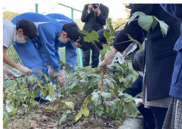
トロアオイ 収穫の様子。 収穫したもの は卒業証書 すきに使いま した！

湯本高校遠野校舎の生徒の皆さんと一緒に 卒業証書漉きをしました！また、昨年の 春から生徒が一生懸命育てた楮とトロアオイ の収穫も行いました。 卒業証書の出来上がりが楽しみです。