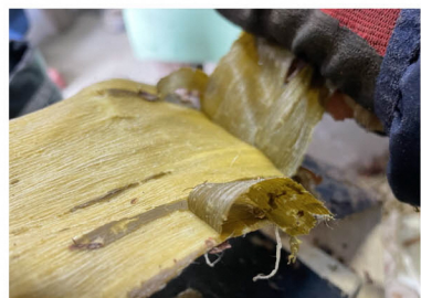
楮の表皮(黒皮)取り