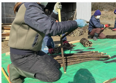
蒸した楮の皮むき