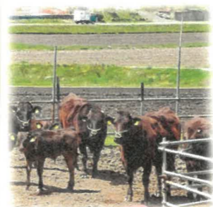
美塩の 牛の繁殖農家が多い