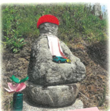
赤ずきんが目立つ 赤野地蔵堂