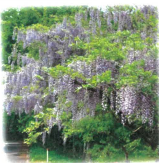
巨木に藤が まわりのけにまわい