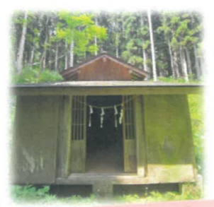
旧美塩小中の裏 熊野神社