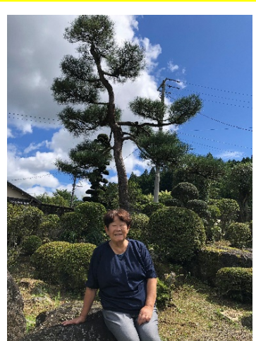
きれいなお庭でパシャリ。庭を手掛けたのは旦那さん。一つの作品のように素敵でした。

田人町には8地区合計6名の女性の支援員さんがいらっしやいます。皆さんのお料理の腕を生かし、農家レストランの実施や、ほっこり祭・ほたる祭りなど田人を盛り上げるイベントに出店という形で尽力されています。集落支援員という制度の認知がまだまだ少ない事と、ここ数年はコロナの影響で大きく活動できない事から「なにかしなくちやならないけど、なにができるんだっぺか・・・」と悩んでおられました。今回は家庭のある女性の身で地域活動に取り組み大変さを教えて頂きました。改めて、仕事や家事の傍ら地域活動に参加している方々に敬服の念を抱きました。