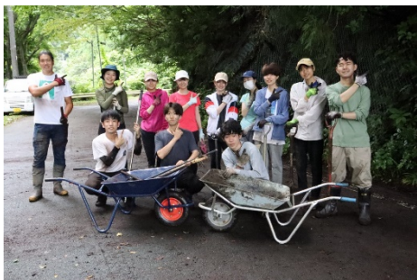
石割桜の柏坂から高松へ向かう旧289号線の道が埋もれ狭くなっていましたが、学生達の力で約幅1.5m長さ80m切り開きました。 何十年振りに白線が見える道になりました!