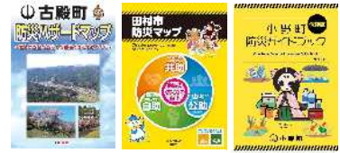
【古殿町】 【田村市】 【小野町】