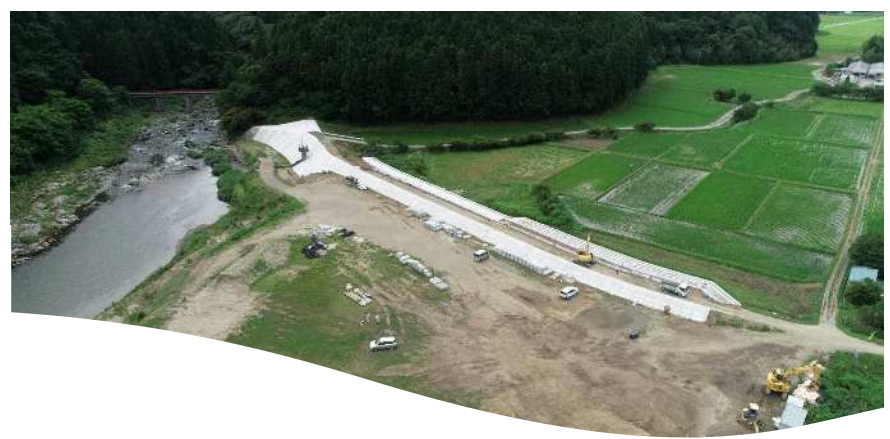
鮫川 遠野町滝地区