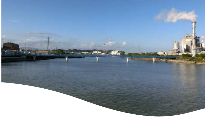
藤原川 みなと大橋上流