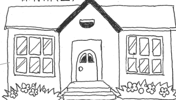
入所申込み...各地区保健福祉センター

共働きなどの理由で家庭で保育することができない保護者に代わって、お子さんを保育するところ