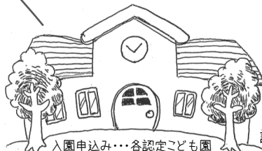
入園申込み...各認定こども園