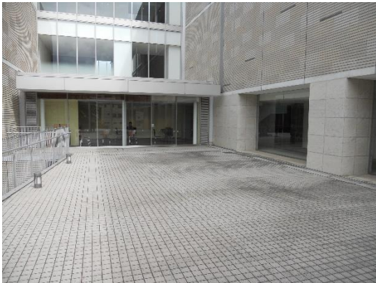
②プロムナード (屋外)