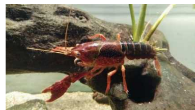
アメリカザリガニ