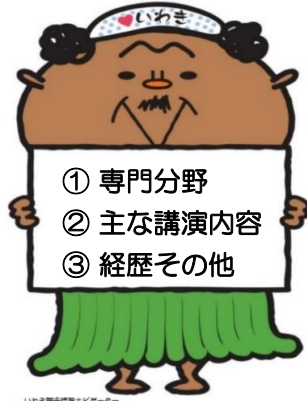
いわき市の環境アドバイザー フラおじさん