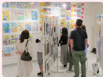
令和元年の展示の様子