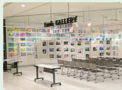
令和元年の展示の様子

※ 新型コロナウイルス感染症の拡大状況によっては、展示を中止し、水道局ホームページでの掲載とする場合があります。