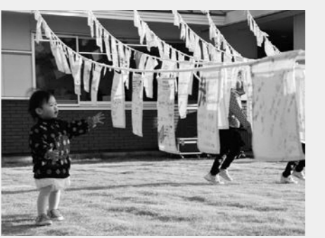
昨年展示した黄色いハンカチ

保健福祉課法人指導係 ☎22-7526 原油価格の高騰による生活困窮世帯への影響緩和のため、昨年12月10日現在で本市に住民登録があり、本年度の市民税が非課税の方のみの世帯へ給付金を支給します。 ☎①65歳以上の方のみの世帯 ②障害者手帳(特別児童扶養手当証書、障害年金証書、要介護4・5の介護保険証、指定難病医療費受給者証を含む)をお持ちの方がいる世帯 ③ひとり親世帯 ※生活保護世帯や市民税が課税されている方に扶養されている方のみで構成される世帯は除きます。 ☎一世帯につき5千円 ☎1月21日以降に送付された確認書に必要事項を記入し、同封の返信用封筒で郵送または対象となる世帯で確認書の送付を受けていない場合は、事前に市コールセンターで提出書類を確認の上、市役所本庁舎、各支所(好間・小川支所は除く)、好間・小川公民館で☎9月30日(金) ※確認書は住民税非課税世帯等臨時特別給付金の確認書と一体になっています。詳しくは、市コールセンター(☎0120-100-944)へお問い合わせください。