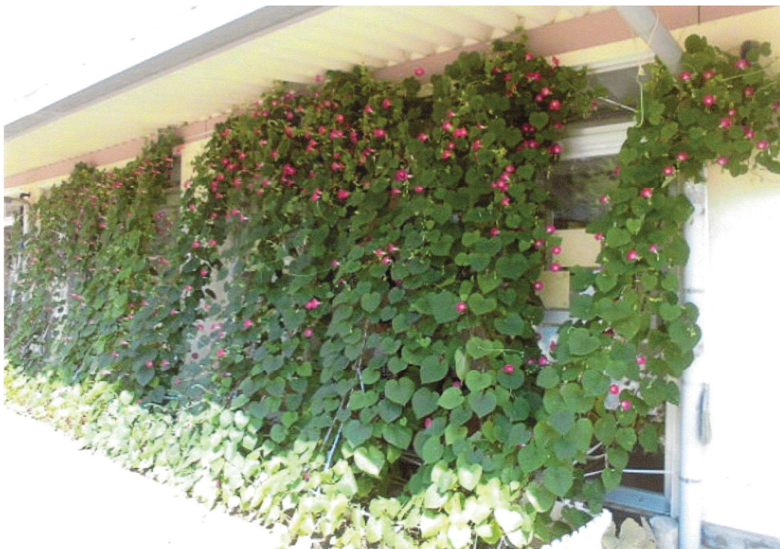
令和2年度 大賞作品 いわき市立本町保育所 様