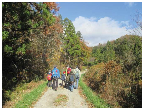
自然探訪会(勝賀岩)の様子