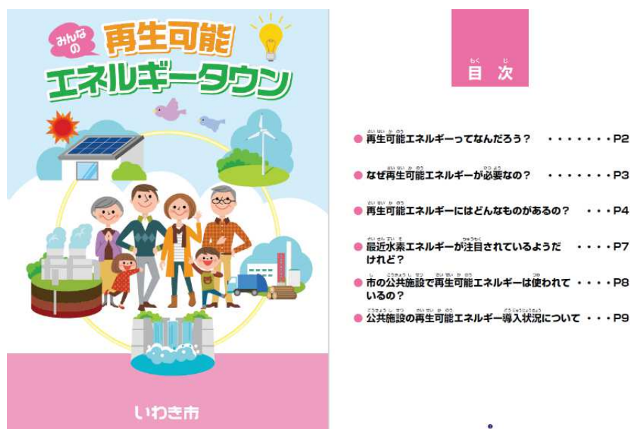
令和2年度作成副読本

本市は、再生可能エネルギーについて理解を深めてもらうため、小中学生を対象とした副読本「みんなの再生可能エネルギータウン」の作成や出前講座「再生可能エネルギーって何？」の開催など、次世代を担う子どもたちをはじめ、市民への啓発事業を実施しています。