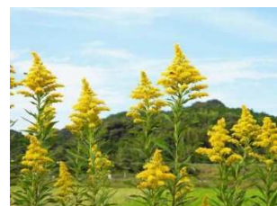
セイタカアワダチソウ