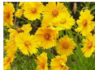
オオキンケイギク