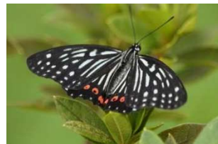
アカボシゴマダラ