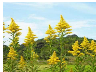
セイタカアワダチソウ