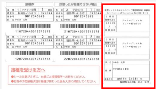
接種済証(接種券の右側)