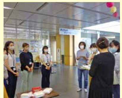
▲編集委員によるHANAプロジェクトへ取材

編集委員: 「おしゃれな商品も多く、どの年代の人にも手に取りやすいと感じました。女性特有の健康問題について悩むことがあっても病院に行きにくい人は多いと思います。まずはこういったフェムテック商品を利用して考えてみるころから始めてもいいかもしれませんね。」