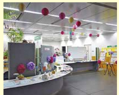
▲フェムテック・メンテック展示会会場