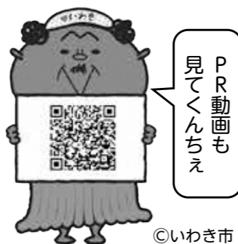
PR動画も 見てくんちえ