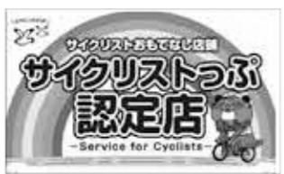
認定店が掲示するステッ カー

サイクリストの利便性を向上する ため、サイクルラックの設置や休憩場所・ト イレなどの提供を行う72店舗を「サイクリス トつづ」として認 定しましたので、 ぜひ活用してくだ さい。詳しくは、 いわき市観光サイ トをご覧ください。