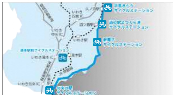
いわき七浜海道全体図

復興サイクリングロード いわき七浜海道は、総延長 約五十三キロメートルの自 転車道路路網です。東日本大 震災からの復旧・復興事業 により整備された防潮堤や、 既存の国・県・市道などを 活用した自転車走行空間と して整備しました。 白砂青松が広がる本市特 有の美しい海岸線に沿って 勿来の関公園から久之浜防 災緑地までをつないでいま す。 市では、全線開通を記念 したさまざまなイベントを 実施していますので、ぜひ 参加してみてください。