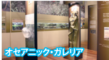
オセアニック・ギャラリー

●アクアマリンふくしまが取り組んでいる研究や活動を、ブースに分けて分かりやすく紹介しています。