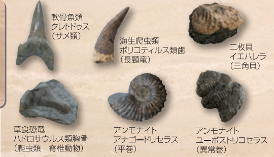
軟骨魚類クレドックス(サメ類)