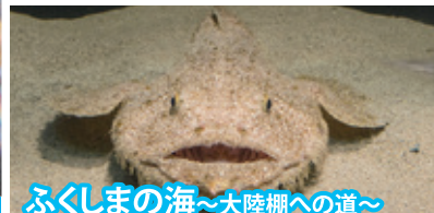
ふくしまの海~大陸棚への道~

●福島県の海は、大陸棚から深海へとつながります。ここでは、大陸棚へスポットをあて、豊かな漁場の多様な生物を展示しています。