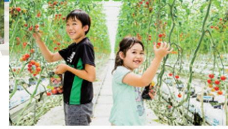
トマトの収穫体験

大型のハウスでトマトの収穫体験ができます。5種類の色とりどりの新鮮なフルーツトマトなどをその場で食べ比べて、袋一杯に詰めてお持ち帰りいただけます。 所要時間:約30分 料金:1,100円