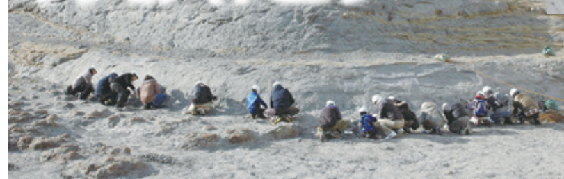
体験発掘で見つかる化石