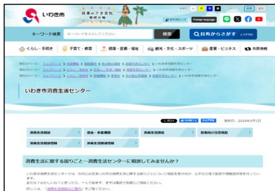
市公式 SNS (LINE)