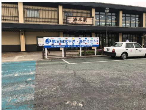
J R 湯本駅前