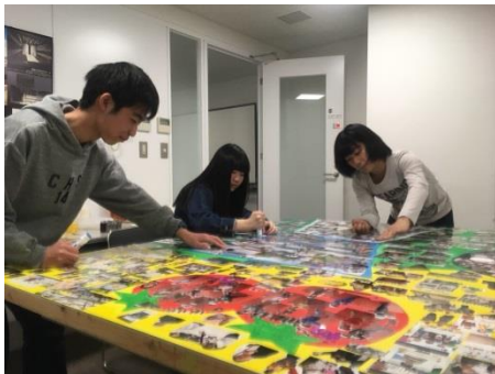
制作作業に取り組む高校生応援隊

高校生応援隊が、様々な市内でのイベント等に出向いて、人々の笑顔の写真を多数集め、写真アートパネルを制作した。サミット当日、各国首脳の目に留まるよう、メイン会場であるスパリゾートハワイアンズ内に設置した。