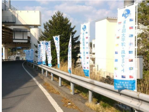
いわき中央 IC 入口付近