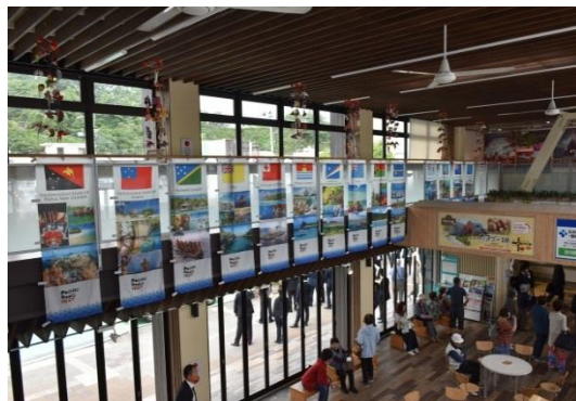
J R 湯本駅構内