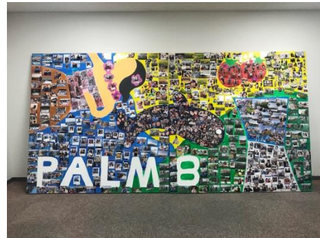
写真アートパネル（完成品）