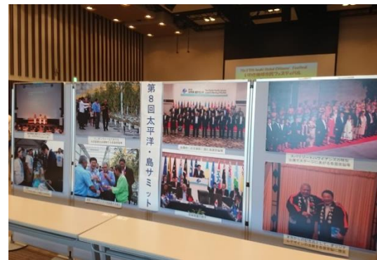
第17回いわき地球市民フェスティバルでのパネル展示 〔平成30年10月27日（土）〕