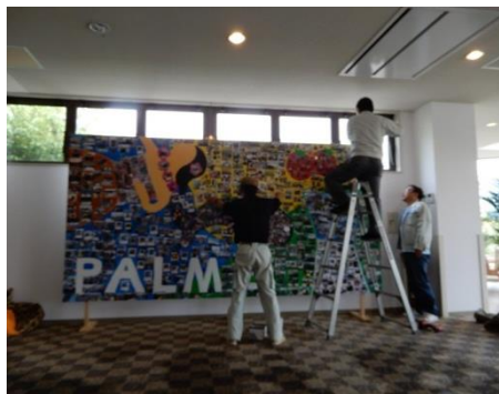
スパリゾートハワイアンズ内にパネルを設置した。