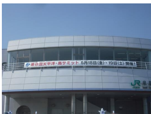
J R 泉駅