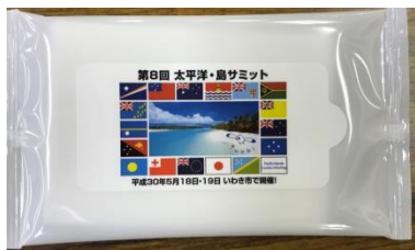
ウェットティッシュ