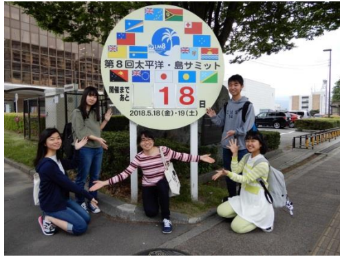
カウントダウンボードの前で写真を撮る高校生応援隊