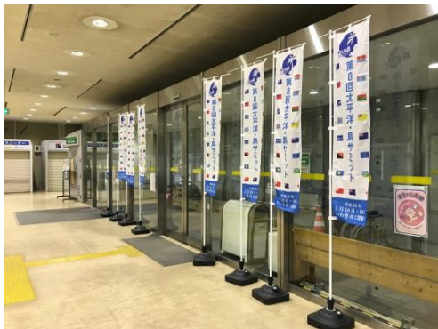
いわき市役所 入口