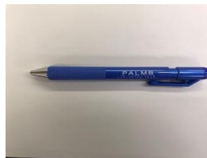
シャープペンシル