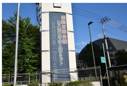
いわき市役所 多目的大型表示盤