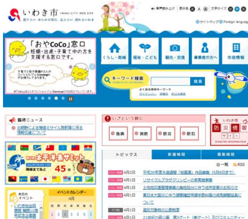
市公式ホームページ