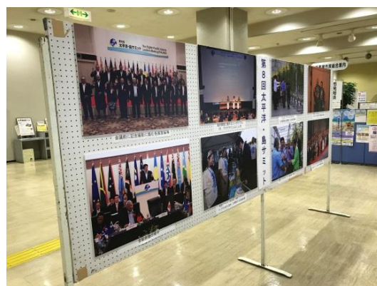
市役所本庁舎 1階ロビーでのパネル展示 〔平成30年10月1日（月）～10月12日（金）〕