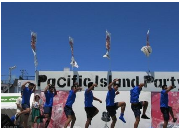
サモアの高校生ラグビー選抜チームによるサモアダンス。