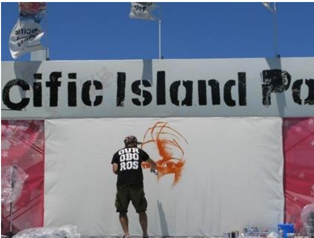
大きなキャンパスに、そのとき感じたままを即興で描く、ライブアートパフォーマンス。