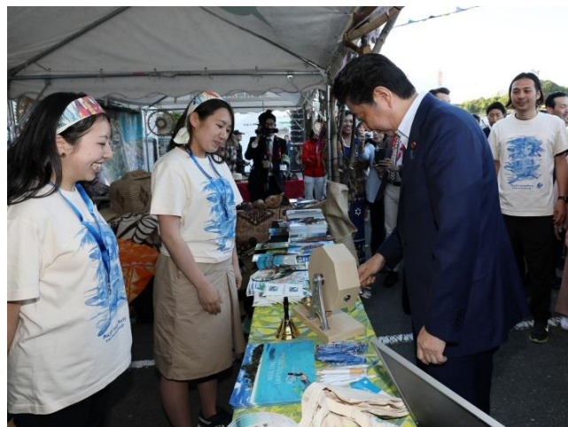
イベントを視察する安倍総理