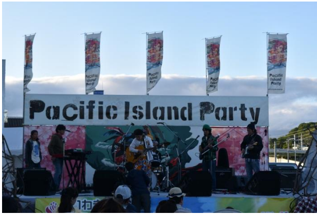
会場を盛り上げる音楽ライブ。