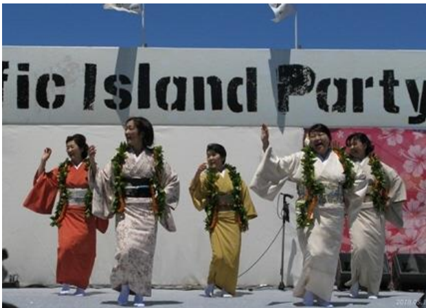
フラ女将によるフラショー。