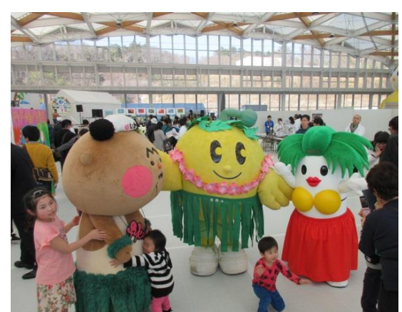
ゆるキャラ等と子供たちのふれあい