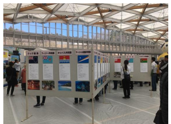
各国の情報パネル