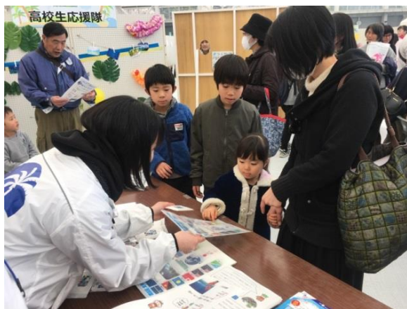
サミットをPRする高校生応援隊