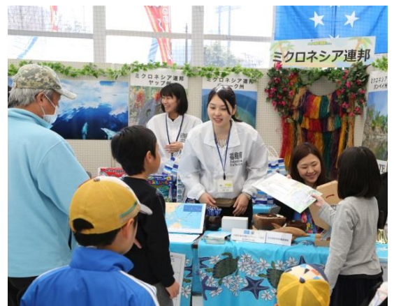
ミクロネシア連邦大使館ブース