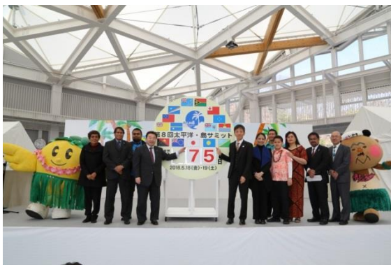
開会式でのカウントダウンボード挿入。