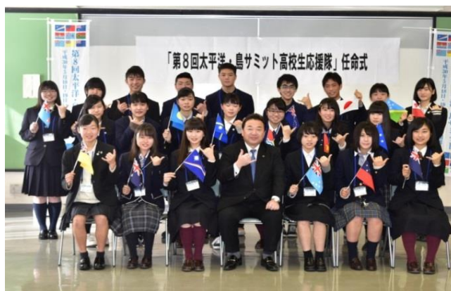
平成30年1月20日（日） 高校生応援隊任命式