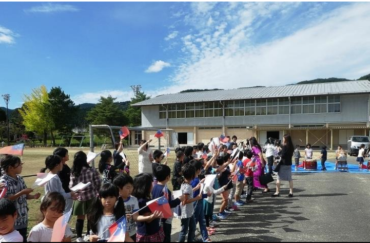
ホストタウン交流事業「駐日サモア独立国大使による学校訪問」の様子（平成29年10月）