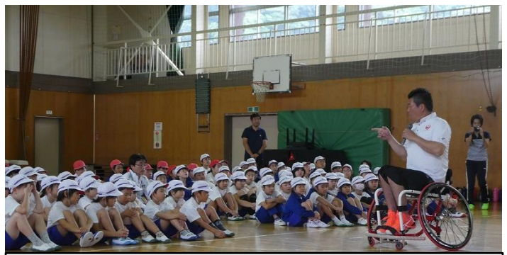
（公財）日本財団パラリンピックサポートセンター主催事業「あすチャレ！スクール」の様子