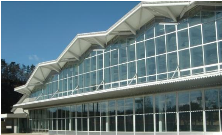
いわきグリーンベース（外観）