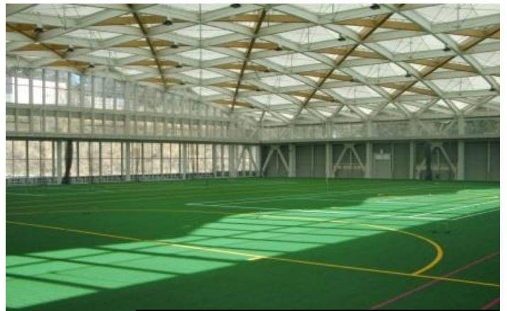
いわきグリーンベース（内観）